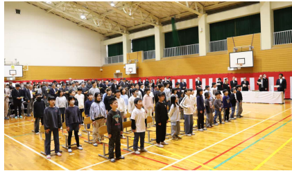
▲全員で最後の校歌斉唱