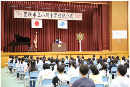
▲児童代表あいさつ

4月7日（火）に、小坂小学校と小野小学校の統合式を開催し、統合準備委員会の委員、地域の代表、学校運営でお世話になっている方々に出席いただきました。 小坂小学校では新2年生から新6年生までの児童が式典に参加しました。 式典では、2名の児童代表が「新しい学校生活への期待がいっぱいです」「たくさんの素敵なことがこれから先に広がっていると思います」とあいさつし、新・小坂小学校での生活がスタートしました。