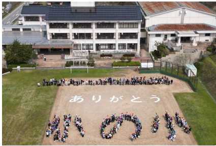
▲ドローンによる人文字撮影