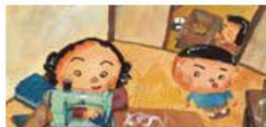
『おかあちゃんがつくった』 2012年 講談社