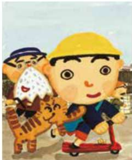
『おじいちゃんのおじいちゃんのおじいちゃんのおじいちゃん』 2000年 BL出版