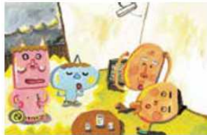
『いいからいいから』 2006年 絵本館