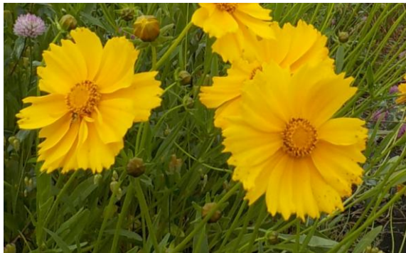
5月～7月頃にかけて黄色の花が咲きます