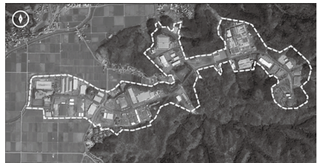
産業用地の候補地となる適地を選定します。写真は、既に完売している豊岡中核工業団地(豊岡市神美台)

市内企業の事業拡大や新たな企業誘致の可能性を探るため、産業用地の適地選定に向けた調査・検討を開始します。既存の産業用地が完売している現状を受け、今後の企業の投資意欲を確実に取り込むためには、中長期的な視点での用地確保の検討が欠かせません。将来の豊岡の産業を支える拠点の在り方について、専門的な分析に基づく候補地の選定を進めます。