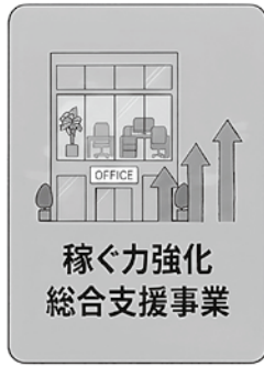
稼ぐ力強化 総合支援事業