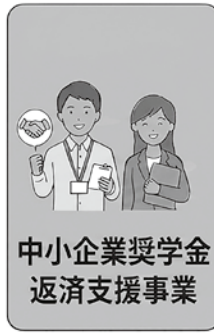
中小企業奨学金 返済支援事業