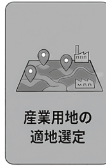
産業用地の 適地選定