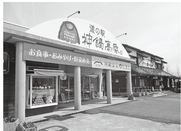
道の駅 神鍋高原のサステナブル観光・防災・生活の拠点化を目指します

※本紙に掲載している情報は編集時点(5月14日)のもので、変更になっている場合がありますので、注意してください。