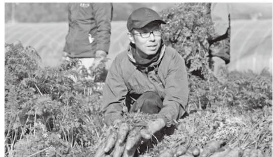
豊岡オーガニックワークスの圃場