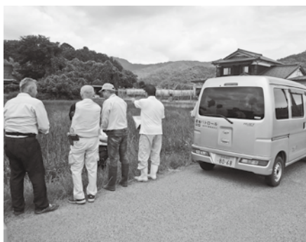
農地パトロールの実施

終わりにりましたが、委員の皆様、地域の皆様のご協力により活動できましたことに御礼申し上げます。