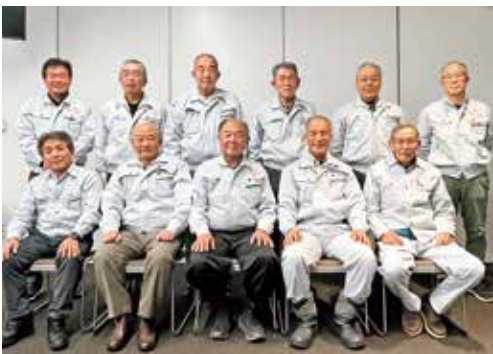
農委だより第63号は私たちが担当しました。