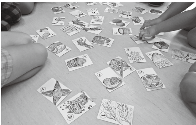
こども園でのかるた体験

の認定こども園等で、かるた体験を実施しました。2023年、豊岡市は「オーガニックビレッジ」を宣言しました。行政の主導により次代を担う子どもたちがより安全安心な給食を食べられるよう願うばかりです。また農業委員として農業の地域ぐるみの活動の継続と食料自給率向上に貢献していく責務があると考えています。各委員の方々、地域の皆さんにご協力とお力添えをいただき心より感謝申し上げます。