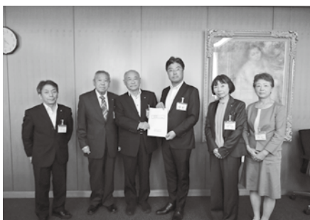
市長へ意見書提出

次世代を担う子どもたちに、野菜作りを通して農業への関心を高め、担当地域の認定こども園と連携し様々な野菜の栽培と収穫、クッキングまでを体験する活動を実施してきました。また地域の伝統野菜を「農業委員会だより」で紹介し、豊岡の伝統食を盛り込んだ「豊岡うまいもんかた」を女性委員を中心に作りました。子どもたちが地域の伝統食や野菜を知る機会になればと思いい地域の委員の方々と共に市内各地