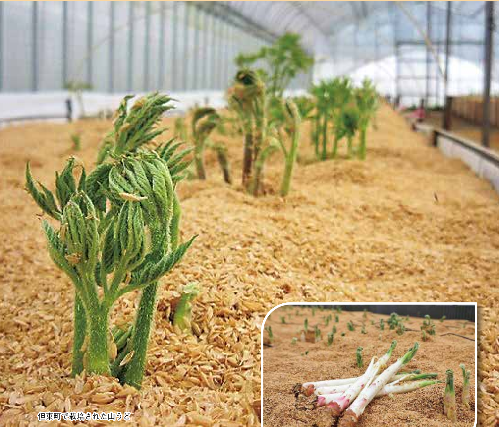
但東町で栽培された山うど