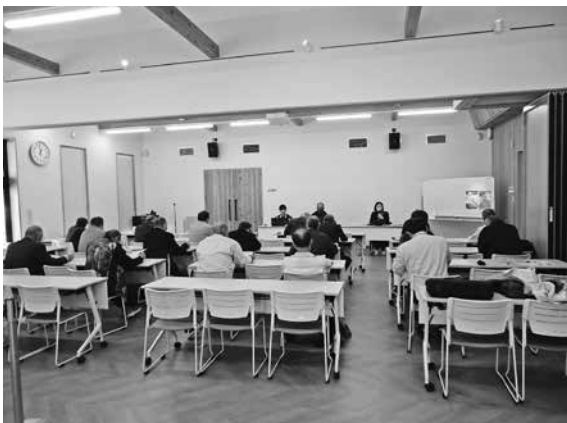
施設の概要などを聞く

その後、クレー射撃場やライフル棟を視察しました。ライフル棟では銃猟免許所持者の試射を見学し、その発射音の大きさにびっくりしました。また、エアライフル棟では競技用のエアライフルやピストルの練習場が完備され、ピストムライフルは、狩猟免許を持たな