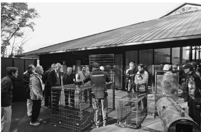
獣捕獲のための箱わな