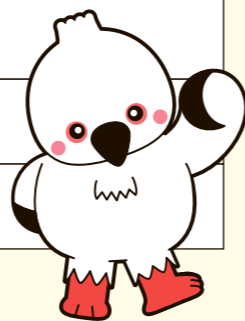
豊岡市マスコット "オーちゃん"