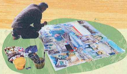
成田壽郎《こんにちははベラスケさん》 《ねこの見た夏》《不詳》