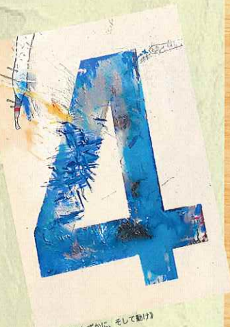
成田壽郎《4しずかに、そして動け》