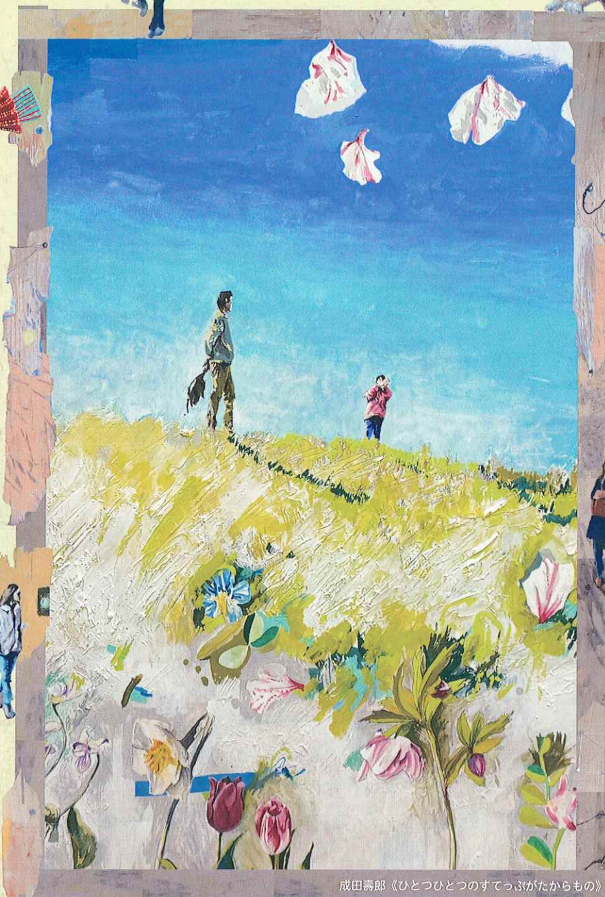
成田壽郎《ひとつひとつのすてっぷがたからもの》