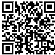
▲申請方法などの詳細はこちら