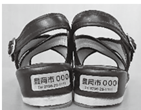
ステッカーを貼った靴

市内に居住するおおむね65歳以上の方で、認知症等により行方不明になる心配のある方であれば誰でも登録できます。事前登録することで、万が一の時、本人の特徴や写真、緊急連絡先などの情報を、高年介護課・豊岡消防署・豊岡警察署が共有し、スムーズな捜索活動につなげます。