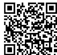
▲開港30周年記念キャンペーンの詳細はこちら