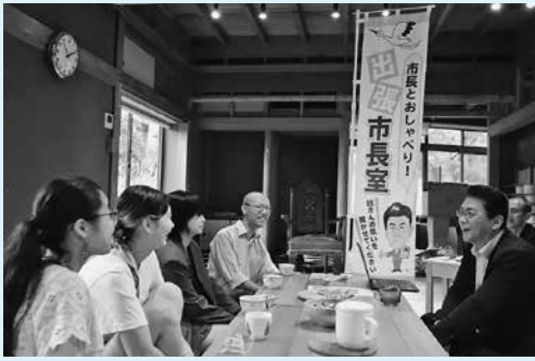
▲これまで行った活動の報告や今後何に挑戦していきたいか、今後の豊岡市への思いなど、ざくばらんに話しました

10月8日には、NPO法人但馬アーツコミンズのメンバーが住居であり活動拠点としているシェアハウス江原101で、市長と意見交換を行いました。参加者は「市役所の会議室でなく、この場所を見てもらい、私たちと同じように床に座って話をするのができて良かったです」と話していました。