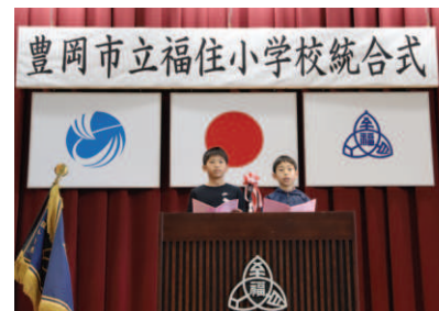
▲児童代表あいさつ

式典では、2名の児童代表が「仲間とともに力を合わせて素晴らしい学校をつくっていきます」とあいさつし、新しい友達との学校生活がスタートしました。