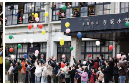
▲全員での風船飛ばし