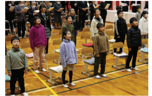
▲全員で最後の校歌斉唱

式典の終了後には、地域主催による閉校記念行事が行われました。児童による鼓笛隊演奏や合唱の後、全員で写真撮影や風船飛ばしを行い、なれ親しんだ母校との別れを惜しみました。