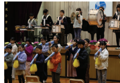
▲児童による鼓笛隊演奏