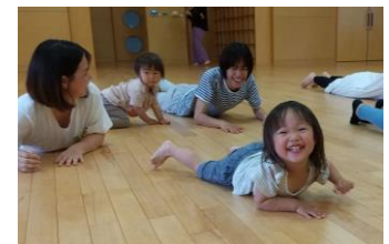
ワニさんに変身♪ (日高子育てセンター)