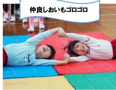
仲良しおもゴロゴロ 友達と一緒に遊ぶのが嬉しい♪