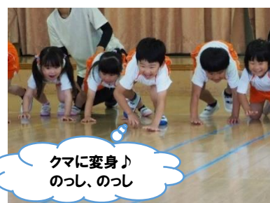
クマに変身♪のっし、のっし 動物変身で体の力をたっぷり育もう!