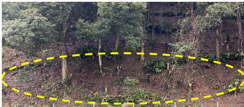
施業後のイメージ

※実際にかかった経費が、700,000円/haを下回った場合はその金額とします。