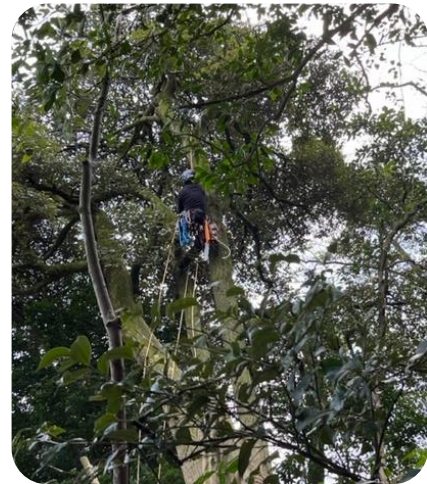
実例：危険木の伐採作業 (津居山区 2022)