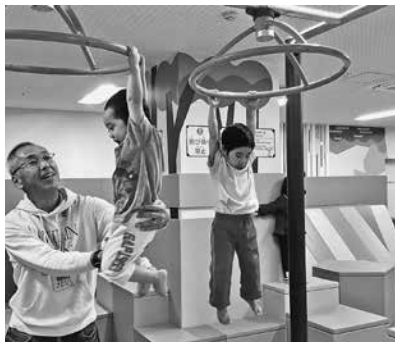
くるくる回るリングに ぶら下がりチャレンジ