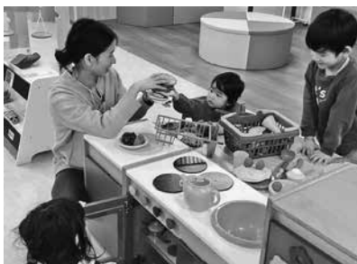
みんなでおままごと

こども広場は、遊びの研究や世界の遊び道具の販売をしている企業「ボーネルンド」が監修しています。子どもの「こころ・頭・からだ」を育てる遊具がたくさん！ 遊び方が分からない場合は気軽にスタッフに声を掛けてください。