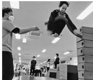
「エアトラック」の上で ジャンプ