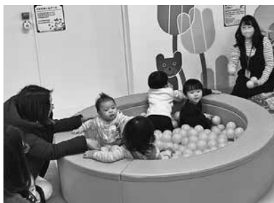
赤ちゃん用ボールプール