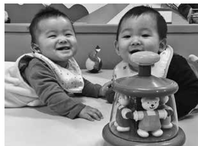
ベビーエリアのマットはふわふわで 赤ちゃんが安心して遊べる