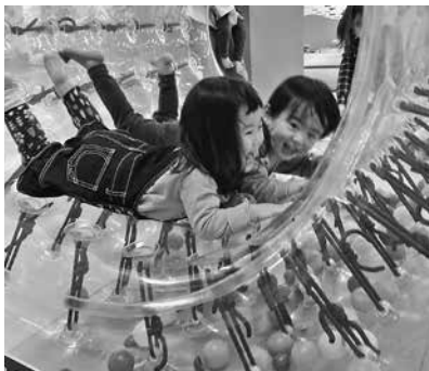
大人気のサイバーホイールで ぐるぐる