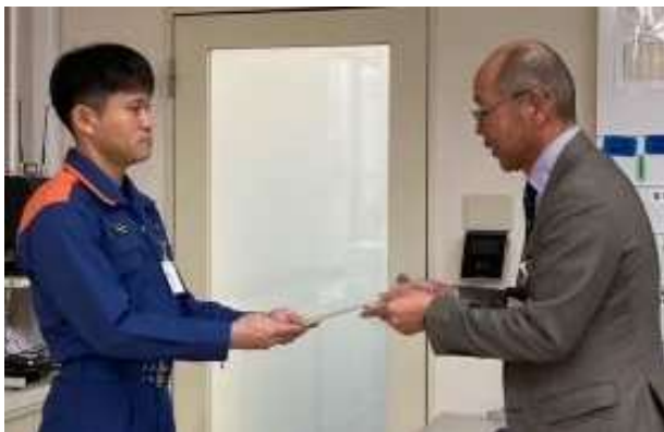
育児休業応援メッセージの交付