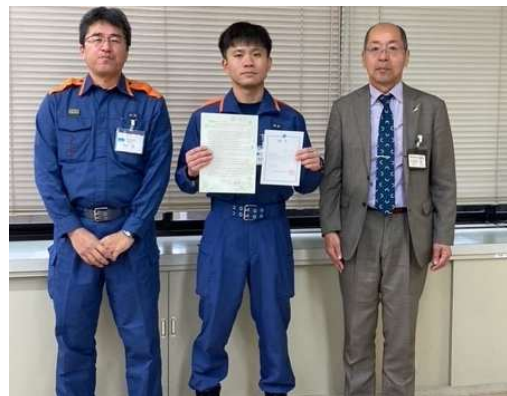
所属長からの辞令交付