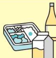
スーパー・コンビニ