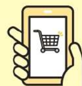
ネットショッピング