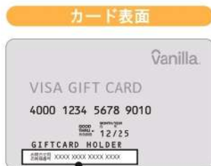
お問合せ用お客様番号