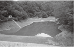
菅谷地区のため池

農地利用最適化推進委員として早くも6年が経過しました。毎年7月に出石南の農地パトロールを実施し遊休農地の確認、11月に利用意向調査を行っています。町中では農業者が少なく役員も大変ですが、多面的機能支払交付金事業に取り組み、遊休農地は減少しています。