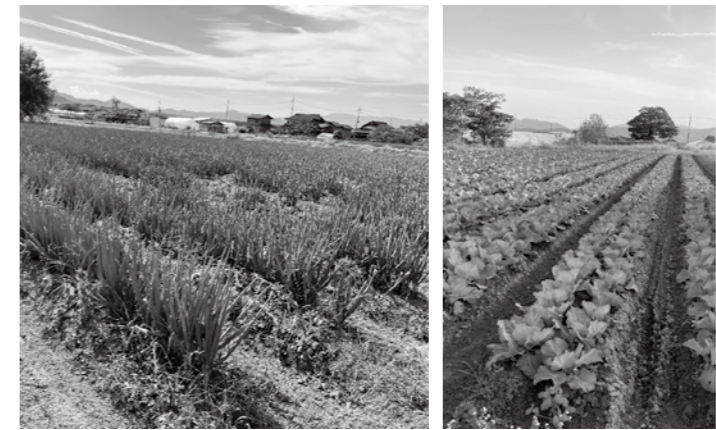
中筋地区の農地の様子

そのような中、おかげさまでこの中筋地区は他地区に比べて山地が少なく平地農業のため、昔より、野菜の販売を主に発展してきました。現在では管理されたビニールハウス栽培を主軸にイチゴ・トマト・キュウリ・ネギや軟弱野菜の生産が盛んですが、野菜生産は兼業では難しく1年を通じて専門的技術が必要となるため、生産農家は限定されます。その忙しい合間をぬって専業プロのご指導をいただき、若き新規就農者も増えて、遊休農地の活用が図られ、その努力・行動力に感謝申し上げます。各家庭の高齢者も昔取った杵柄で野菜作りも上手で、安全野菜を市場や地区に2か所ある『朝市』に出荷され大変賑わっております。皆様もぜひおいでください。