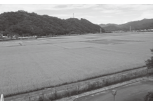
室見台地区の農地の様子

菅谷地区及び室見台は豊岡市の南に位置し、出石の中心から八鹿方面へ約5kmの山間地域です。