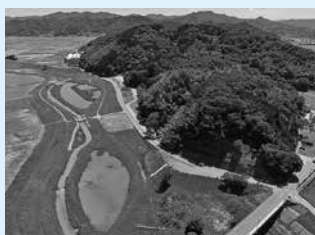
▲「自然共生サイト」で初回認定された「コウノトリ育む中筋の里地里山」。全国では122カ所が認定を受けた