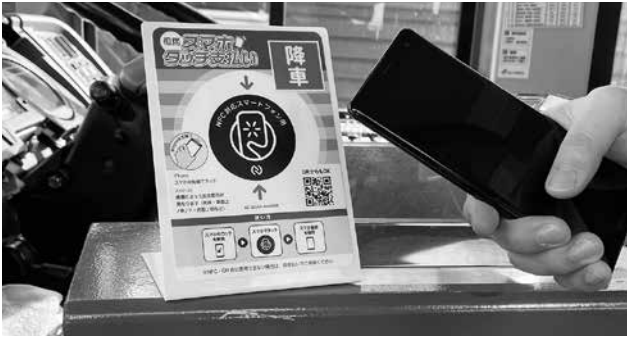
▲乗降時にスマホをかざしてキャッシュレス決済