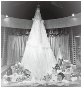
昨年のクリスマスツリー

日 ①飾りつけ…12月4日 ㊄ ②プレゼント交換…12月23日 ㊄ ③26日 ㊄ ④内館内に設置したシンボルツリーを、各自が持参したプレゼント(500円程度)で飾り付け。持ち寄ったプレゼントの中から自分の好きなプレゼントを選んで持ち帰る ¥ ①のみ入館料が必要(一般500円、高生300円、小中学生250円※身体障害者手帳など所持者は半額、県内の小学生はココロカード提示で無料)他12月23日(土)午後1時30分、馬頭琴演奏家・福井則之さんのクリスマスコンサート開催 所 問 日本・モンゴル民族博物館 ☎56-11000