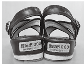
ステッカーを貼った靴

市内に居住するおおむね65歳以上の人で、認知症等により行方不明になる心配のある人であれば誰でも登録できます。事前登録することで、万が一の時、本人の特徴や写真、緊急連絡先などの情報を、高年介護課・豊岡消防署・豊岡警察署が共有し、スムーズな捜索活動につなげます。