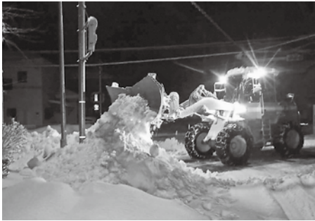
▲除雪作業の総距離は、約745km。豊岡市から岩手県盛岡市までの直線距離に相当

本市の除雪期間は12月1日～3月31日です。道路交通の確保を優先するため、幹線道路や通学路などをあらかじめ除雪路線として定めています。積雪の深さが15cm以上になると除雪を開始し、おおむね午前8時30分までに作業を終えるようにしています。除雪作業をスムーズに行うために、次のことに協力をお願いします。