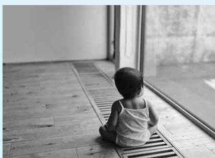
▲今後は、県警本部と連携し、児童虐待案件に対応する