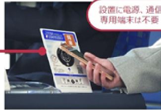
<バス車内のNFCタグ設置例>