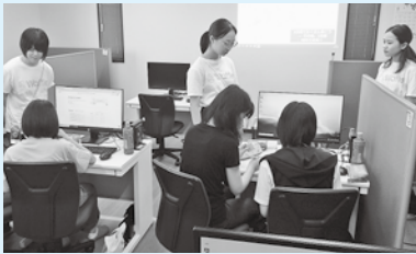
▲助言者の女子大学生からアドバイスを受けながらウェブサイトを作成する女子中高生

体験キャンプには、4人の女子中高生が参加し、プログラマーとして市内で働く女性や国際的なアプリ開発コンテストに参加した市内の女子高生の体験談などを聞いたたり、ウェブサイトの制作に挑戦しました。最後は、制作したウェブサイトを各自で発表し、助言者から講評を受けました。参加者の一人は「将来、情報系の仕事を目指しています。今後の進路について深く考えることができました」と感想を述べていました。