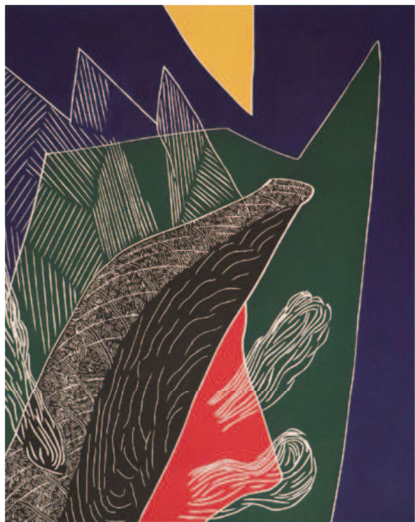
Arnold Shives 「Mist over the Squamish」