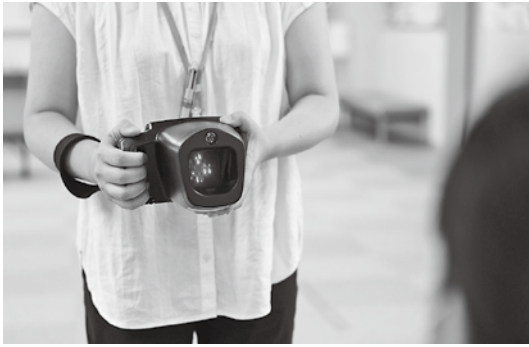
▲1m離れた場所から画面に写る光を数秒間見つめるだけで斜視や屈折異常の検査ができるスポットビジョンスクリーナー

子どもの目は、生後1カ月からはほとんど見えません。6歳くらいで大人並みの視力(1.0)になりませんが、強い遠視や乱視、斜視があると、視力の発達が進まってしまう、弱視になることがあります。 弱視は3歳児健診で発見できれば就学までに治すことができますが、就学年齢になっ