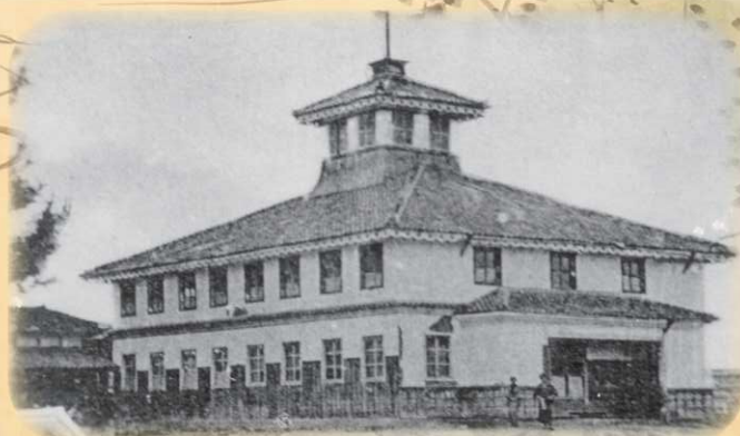
豊岡小学校(明治8年)