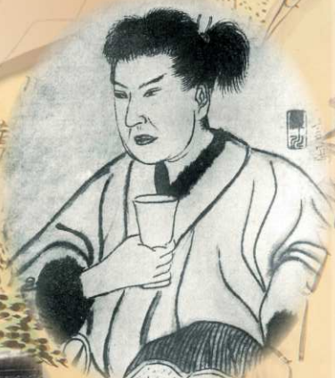
多田弥太郎肖像 (『但馬志士伝』より加工)