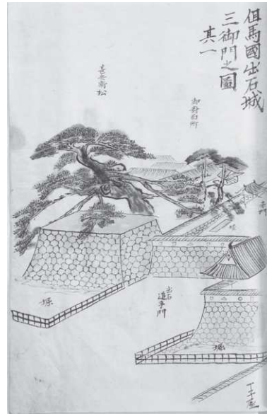
かていむかしばな 禾亭昔噺し

今回の展示では、幕末～明治維新时期に豊岡では何が起こっていたのか、知られざる人物や出来事を、残された数々の資料からわかりやすく紹介します。教科書等からしか知ることのできなかった幕末・維新を、新たな視点で見ることで、現代につながる歴史として身近に感じていただけたら幸いです。