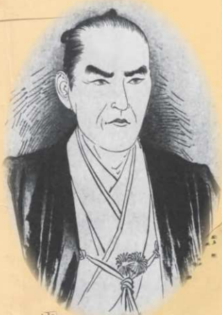
田中河内介肖像