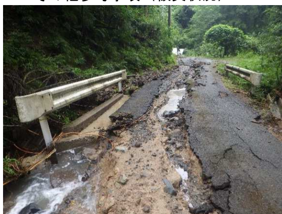
▲日高 道場・浅倉線