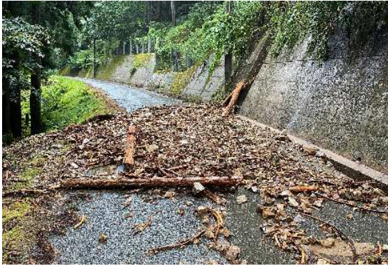
▲竹野 桑野本川南谷線