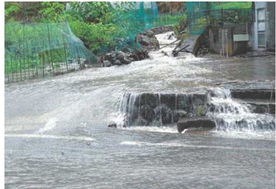
▲竹野 大森地内（河川）