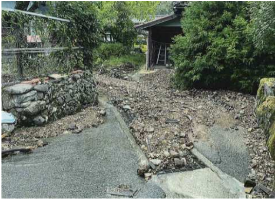
▲出石 暮坂地内（河川）