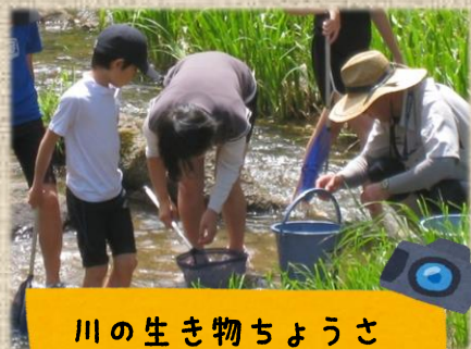
川の生き物ちょうさ