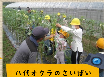
八代オクラのさいばい