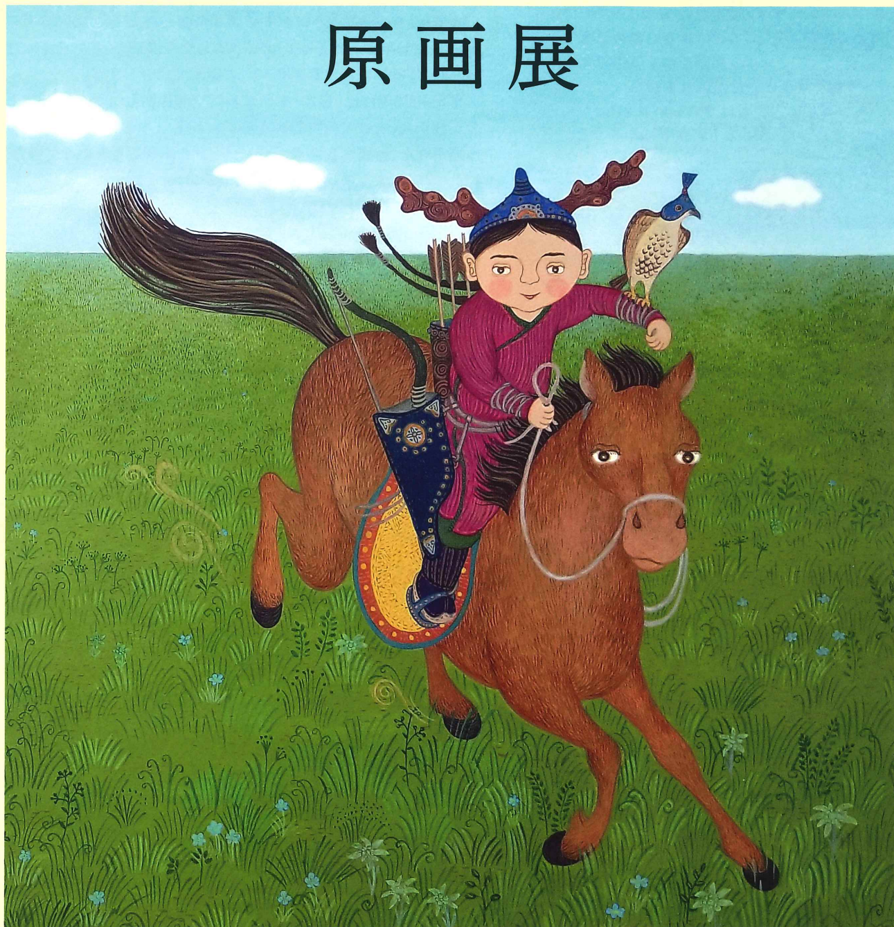
『モンゴル大草原800年』(福音館書店)より部分