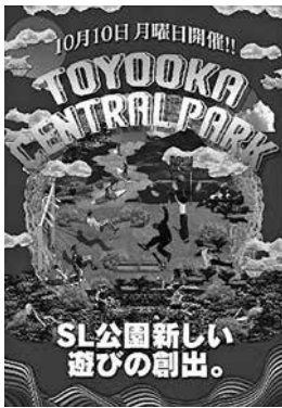
スケボーイベント開催のため自ら制作したポスター

コロナの影響で思うように活動ができなかった間は、地域の方と交流を深めたり「まちの基地アンテナ」を整備したりしていました。現在、ようやくイベントを開催できるようになって、自分がやりたかったことが形になりつつあります。