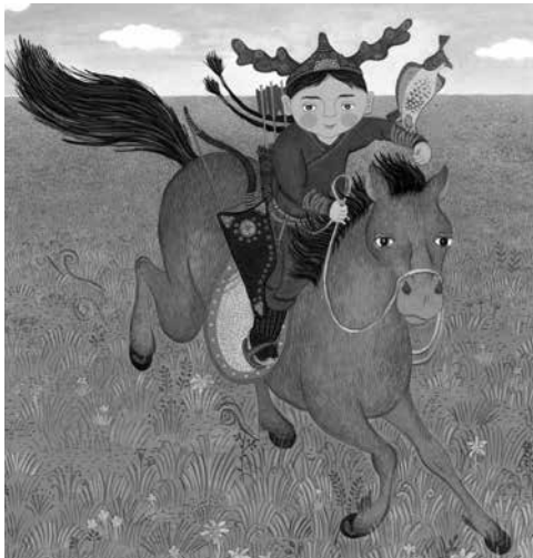
▲『モンゴル大草原800年』（福音館書店）

モンゴルの自然や文化を素材とした絵本を、日本で多数出版している作家のガンバートル&ボロルマー夫妻。2人は、チンギス・ハンがモンゴル帝国の王となる1206年ごろから現代まで、800年にわたるモンゴルの暮らしや風習を絵本にしました。挿絵担当のボロルマーさんが、色鮮やかに緻密に描いたこの絵本の原画を紹介します。また、日本・モンゴルの国交樹立50周年を記念して、当館オリジナルバージョンとして制作された水彩画も合わせて紹介します。