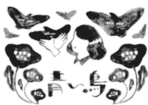
イラスト：嵯峨ふみか

みんなでワクワク！子どもも大人も一緒に楽しめる劇場作品。初めての観劇を、ぜひ豊岡演劇祭で。