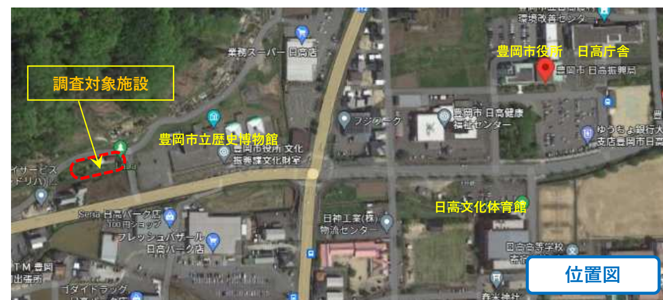
資料 1 調査対象施設 位置図等