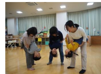
逆さまで、あいさつしよう♪ (子育て総合センター)