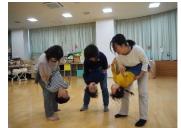
逆さまで、あいさつしよう♪ (子育て総合センター)