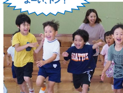
【八条認定こども園】