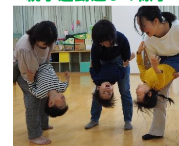
逆さまバァ〜！ (子育て総合センター)