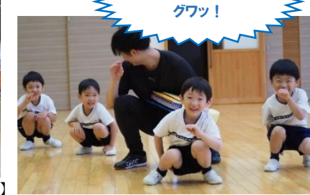
【こうのとり認定こども園】