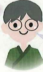
ビンさん (ベトナム出身)