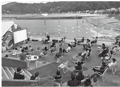
▲ピアノ生伴奏付きの野外サイレント映画鑑賞会（竹野海岸にて）

ヤリティ上映などを実施し、市内外の多くの方に映画を楽しんでいただきました。 あの「暗闇」を守るために 映画には「暗闇」が必要不可欠な要素です。技術面での理由もありますが、映画に集中できるからです。映画は「世界へ開かれた窓」と言われています。時には現実の世界から離れても良いはず。嫌なことはいったん横に置いて、スマホの電源を切って、暗闇の中に光り輝く映画の世界に没入してほしいです。