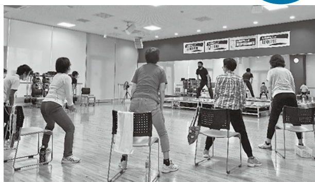
▲フィットネススタジオでストレッチ体操

運動は何歳から始めても遅くありません。効果を出すためには正しい方法で行うことがポイントです。はつらつチャレンジ塾は、個人の体力に合わせた65歳からの健康運動教室です。ウェルストーク豊岡のフィットネススタジオ・トレーニングジム・温水プールを利用します。「運動は苦手だけど、健康のために何かしたい」という方にもお勧めです。仲間と一緒に楽しく体を動かしませんか。