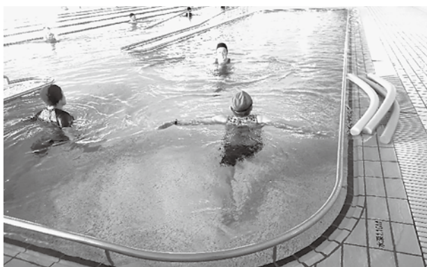
▲温水プールでウォーキング指導