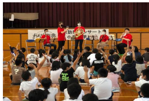
学校訪問コンサート(小坂小、2022.6.3)