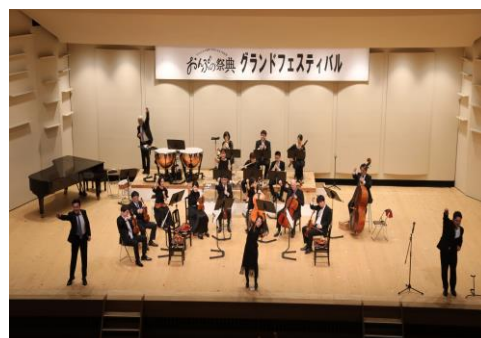
キッズコンサート（2022.6.5）