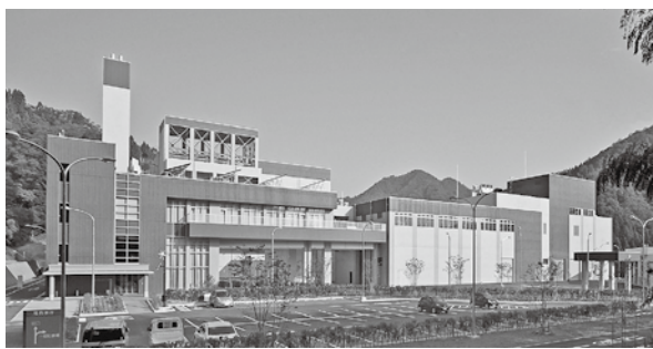
▲水銀使用製品が燃やすごみに混入し、緊急停止が相次ぐクリーンパーク北但

一般廃棄物処理施設「クリーンパーク北但」では、どんな廃棄物でも焼却処理できるわけではありません。血圧計、体温計・温度計、蛍光灯、ボタン電池など水銀使用製品が、燃やすごみに混入し、焼却炉に入ると排ガス中の水銀濃度が上昇するため、焼却を停止しなければなりません。