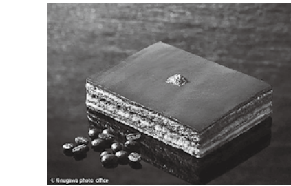
「直感オペラ」ヒグラシ珈琲のコーヒー豆と、フランスの有機チョコレートを使ったケーキ

が積もることも知らなかった私ですが、豊岡のことが好きになりました。面白い、魅力あふれる方々が集まっているからです。