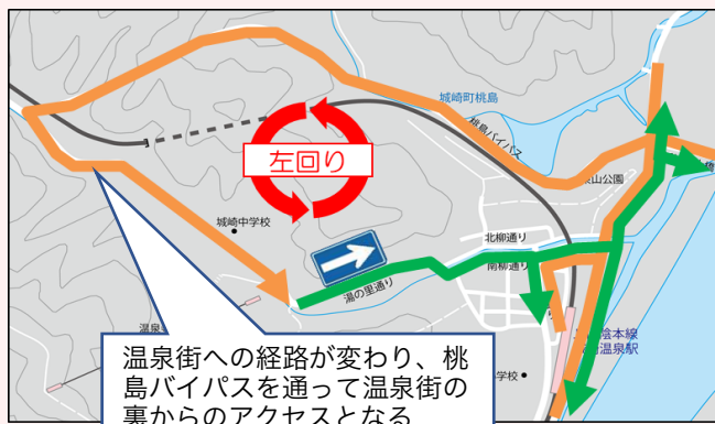
【湯の里通り・東行き一方通行】