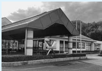
▲継続使用が決定した日高健康福祉センター(上)と出石健康福祉センター(下)