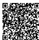
ひとり親世帯以外