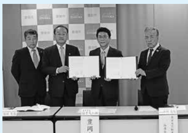
▲兵庫県庁で行った調印式。協定団体を通して物件情報が県内不動産業者に提供され、早期売却が期待される(写真撮影のためマスクを外して撮影)