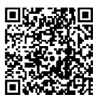
就学援助費受給世帯