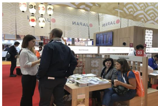
パリ(フランス)で開催された旅行博覧会に出展(2019年)