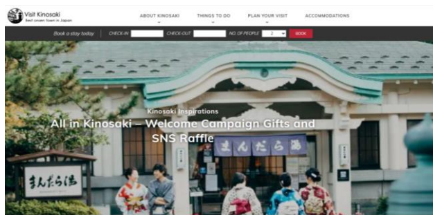
Limited Edition Goods for Visit Kinosaki Users