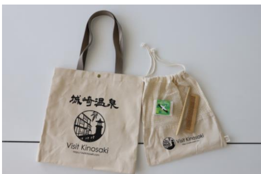
特典付き宿泊予約で宿泊時に提供するトートバッグと竹製アメニティ