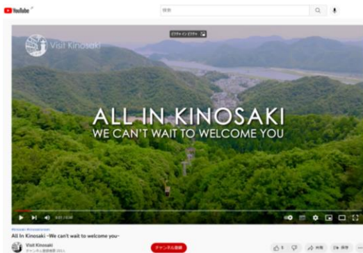
ウエルカム動画の配信(YouTube)

本市を訪れた外国人観光客が、Instagramに旅の思い出を「#visitkinosaki」付きで投稿すると、抽選で30人に「オリジナルエコボトル」をプレゼントするキャンペーンを展開している。(10~1月末)