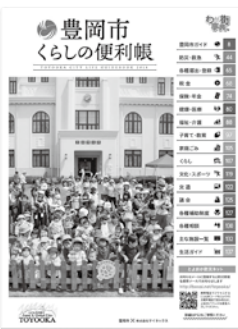
▶前回発行したくらしの便利帳