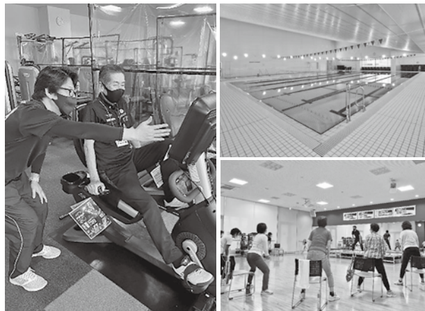
▲専門の指導員がつき、運動初心者でも安心して参加できます