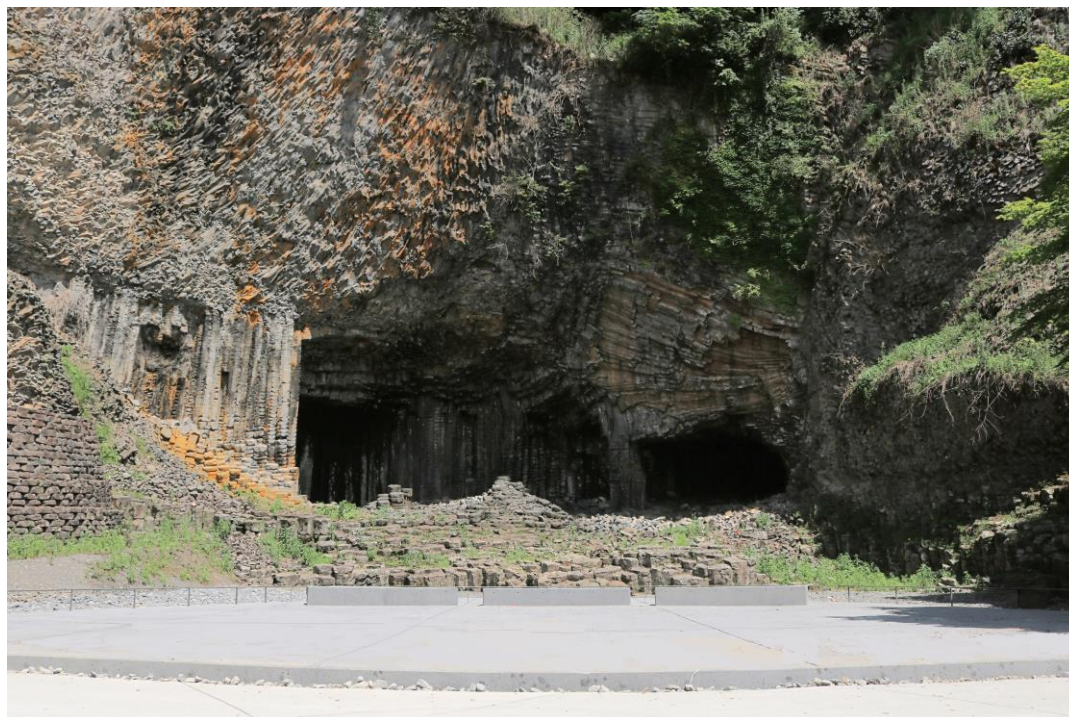
人間を寄せつけない圧倒的な存在感を持つ玄武洞に向き合う場となるように「基壇」を整備