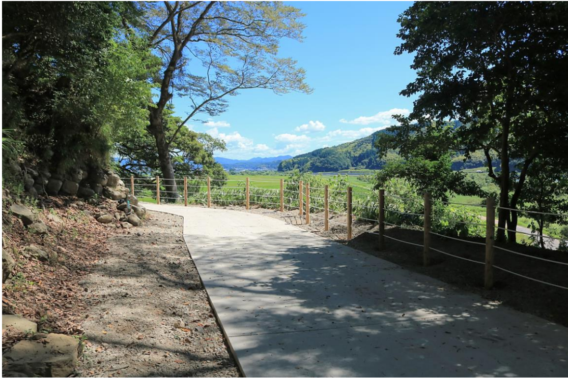
景観に配慮して明度を抑えた舗装に改修された園路