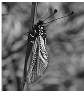
▲キバネツノトンボ