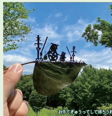
お手でぎゅうってして帰ろうね

でも次々と紹介され、感動と驚きをもって取り上げられています。蒼い空にかざして見えてくるメルヘンの世界は、見る人それぞれの想像力によって喜びやなつかしさ、幸せにかえられることでしょう。「夏のモンぱく」の空にかざして見えてくる景色を楽しんでいただけると幸いです。