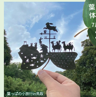
葉っぱの小旅行in鳥取