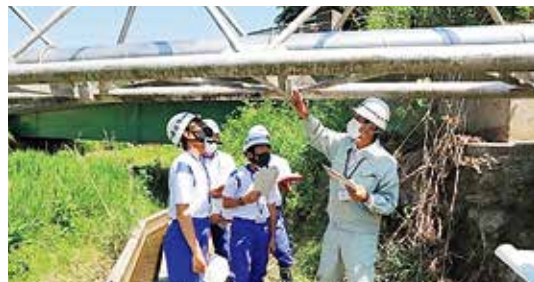
▲水管橋の点検作業体験で、水道課の職員の説明を聞きながら目視で丁寧に確認する生徒たち

ているなど、一つ一つの小さなことが大きな事故につながるかと考えて『小さな変化を見逃さないこと』を大切にして市役所では仕事に取り組んでいることが分かりました」と話してくれました。