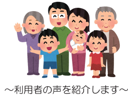
～利用者の声を紹介します～