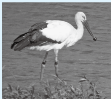
▲くちばしにプラスチック製品がはまったコウノトリ。さまざまな生きものに悪影響を与えている